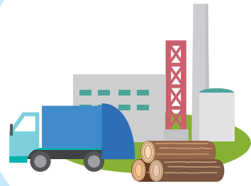
バイオマス発電設備